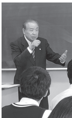
ジェスチャーを 交えて