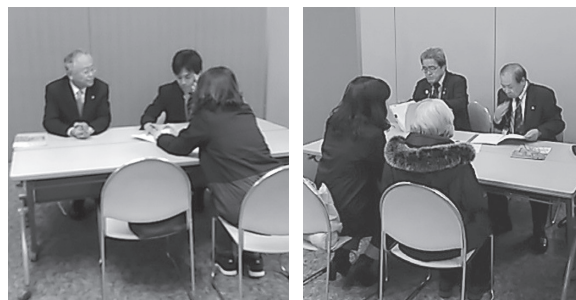
11月19日 様々な相談に対応する支部長など