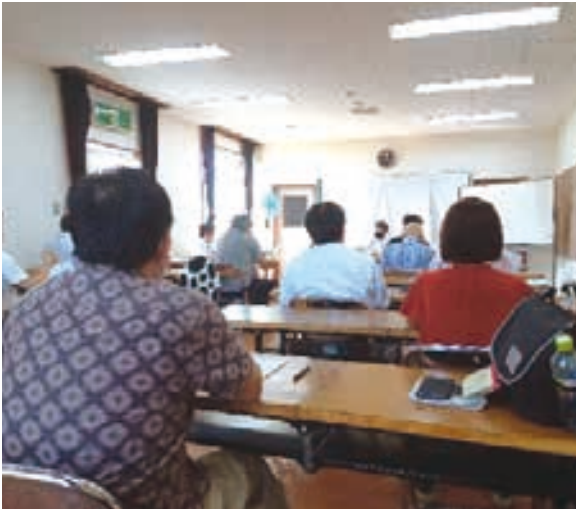
<上画像は自動車関連業務研修の様子>

※事務所所在地、電話番号、FAX番号、補助者等に変更あれば、事務局までお知らせ下さい。